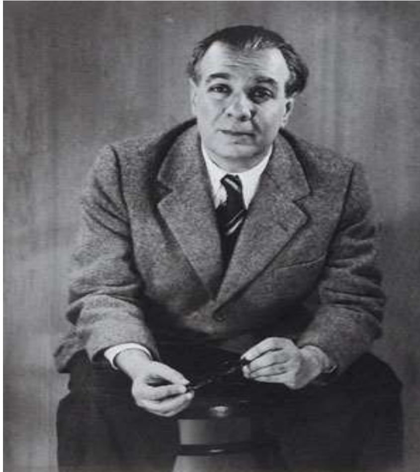
Borges por Grete Stern, 1951.