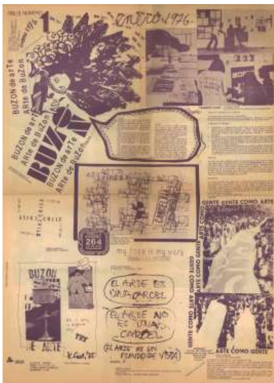
Ensamblado final (partes 1, 2, 3, 4)