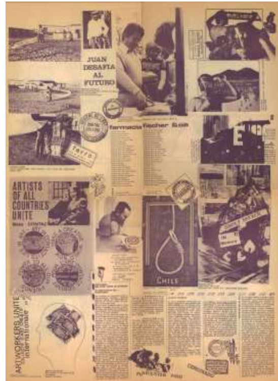
Ensamblado final (partes 5, 6, 7, 8)